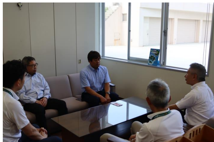
・贈呈式終了後に現状報告をしていただきました