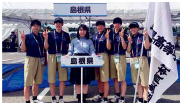
令和4年度全国高校総体総合開会式前のテントにて（徳島県徳島市）

令和5年度、県高体連は設立から75年目を迎え、第61回県高校総体は参加50校、30競技、選手5693人で実施した。体罰根絶への取り組み、教職員の働き方改革、部活動の地域移行をはじめとする部活動改革等、高体連を取り巻く課題は山積するが、特に令和5年度から部員数不足による合同チームの全国大会出場が一部の競技で可能となるなど、部活動にも少子化の影響が表れ始めており、大きな過渡期を迎えている。本県では、くにびき国体のレガシーともいえるホッケー、カヌーなど、安定して全国トップレベルで活躍する競技もある一方で、部員数が減り、部の存続すら危ぶまれる競技も少なくない。現在は中学校を中心に進められている部活動改革の波が、やがて高体連へ波及する日もそう遠くはないと囁かれる中で、部活動の意義や持続可能な部活動のあり方、高体連の存在意義そのものを問われる時代となっている。