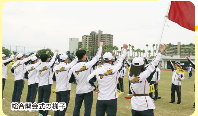
総合開会式の様子