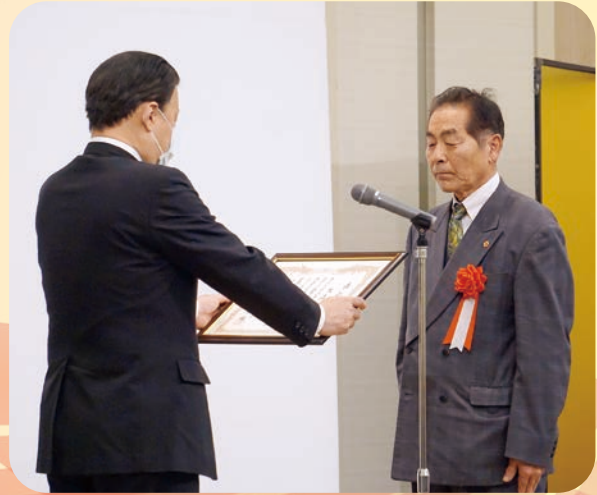
公益財団法人島根県スポーツ協会創立100周年記念式典の様子