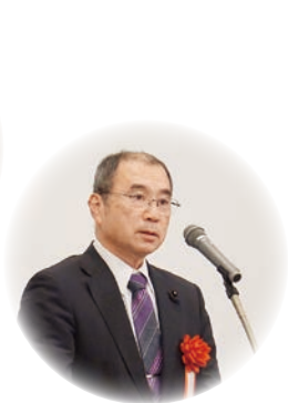
祝辞： 園山繁島根県議会議長