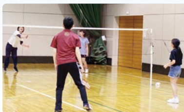
バドミントンとeスポーツと一緒に体験