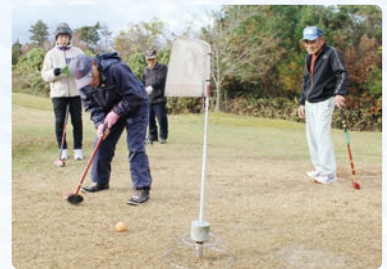
グラウンド・ゴルフ専用コースで交流大会を満喫