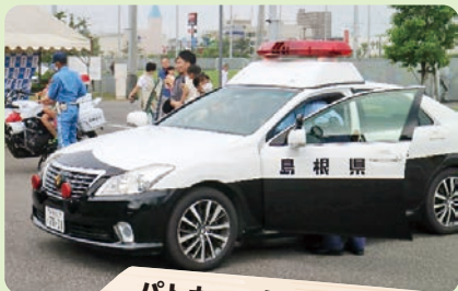
パトカー、白バイ展示コーナー (島根県警)