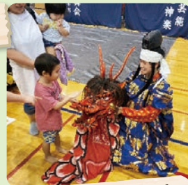
石見神楽 公演 (松江真舞会)