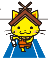
島根かみあり国スポ・全スポ マスコットキャラクター 島根県観光キャラクター 「しまねっこ」 島国・全許諾第7号