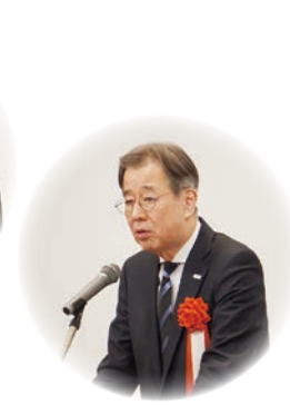
祝辞： 日本スポーツ協会 森岡裕策専務理事