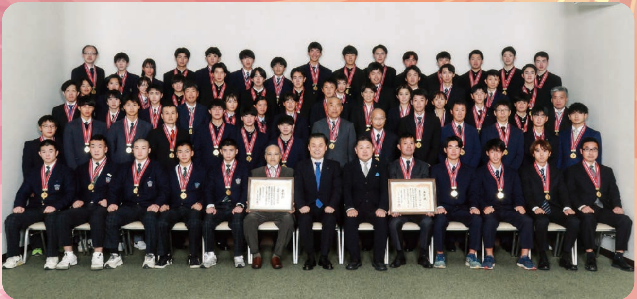
特別国民体育大会優秀選手・監督・優良団体表彰式 令和5年11月21日 於:サンラポーむらくも