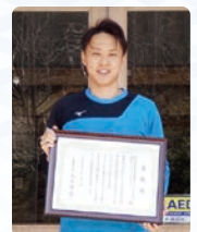
Yu-Gaku加茂 スポーツクラブ