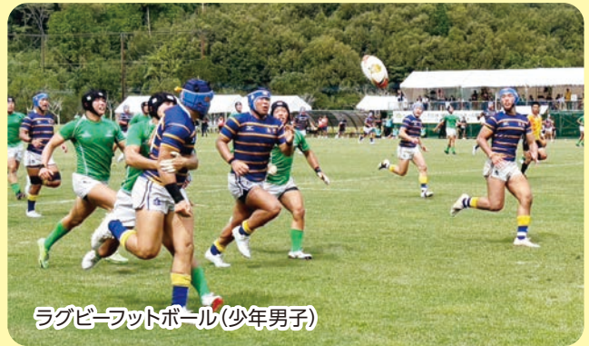
ラグビーフットボール(少年男子)