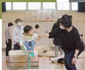
キャンセル待ちが続出 「こんぺいとうクラブ」