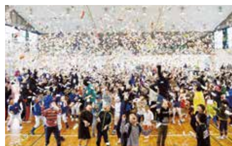
夢と感動を☆クラブフェスタ