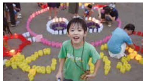
カと心を合わせる♡キャンドルナイト