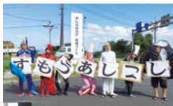
瑞風歓迎「おもてなし部」