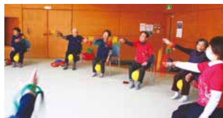
クラブのレジェンド☆健康教室