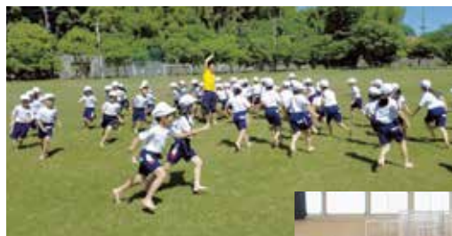
子ども達が 元気で楽しく運動 「わんぱくキッズ」