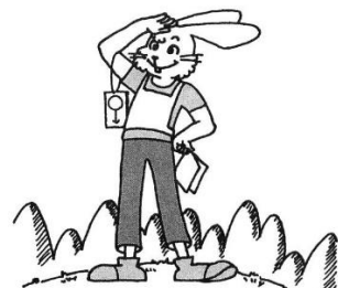
いつもおちついて!