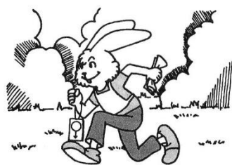
走るだけではだめ!

小雨決行 ☆競技形式 ポイント・オリエンテーリング、ピンパンチ方式 ☆受付時間 13:00~14:00 ☆競技 13:10~15:00（フィニッシュ閉鎖） ☆地図 縮尺 1:10,000 等高線間隔 5m ☆クラス